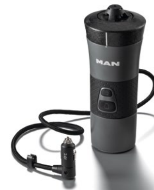
Ekspres do kawy