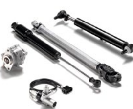
Części układu kierowniczego