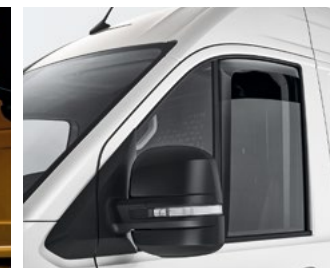
Owiewki do przednich drzwi