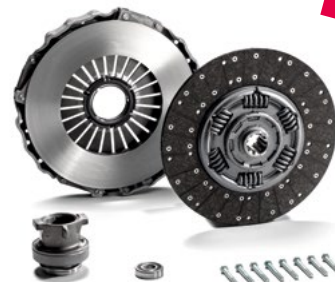
zestawy sprzęgła ecoline