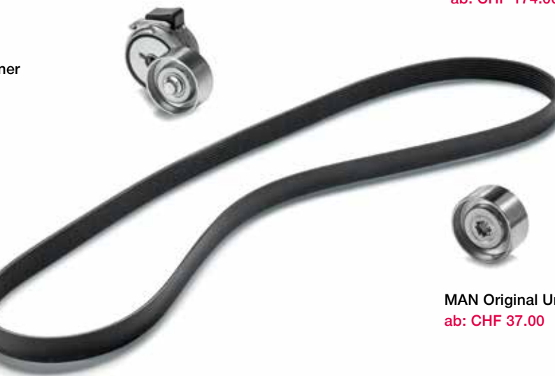
MAN Original Riemen spanner ab: CHF 174.00