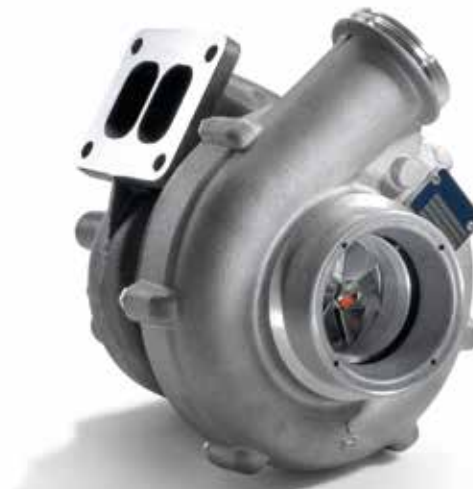
MAN Original Abgasturbo lader ab: CHF 820.00