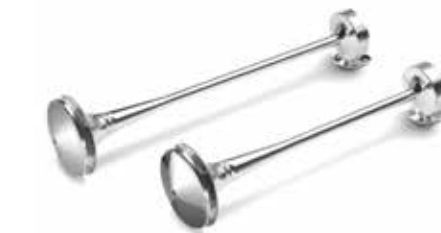
MAN Original Druckluft- und Signalhörner ab: CHF 26.50