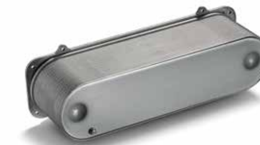
MAN Original Ladeluft kühler ab: CHF 565.00