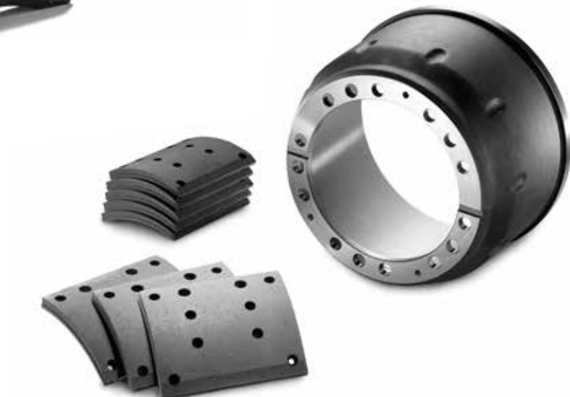
MAN Original Trommel bremsbeläge ab: CHF 123.00