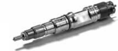
MAN Original Injektoren ab: CHF 447.50