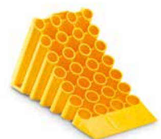
MAN Original Unterlegkeile ab: CHF 31.00