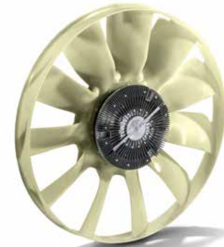
MAN Original Motor lüfter ab: CHF 990.00