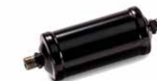
MAN Original Trockenpatronen ab: CHF 94.50