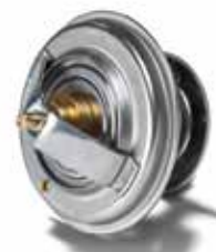
MAN Original Thermostate ab: CHF 17.95