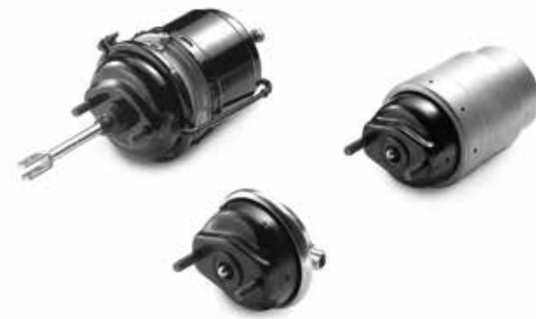
Cylindres de frein d'origine MAN à partir de: CHF 78.75