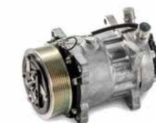
Compresseurs de réfrigération d'origine MAN à partir de: CHF 795.00