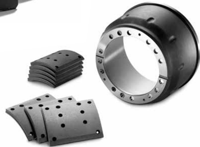
Plaquettes de frein à tambour d'origine MAN à partir de: CHF 123.00