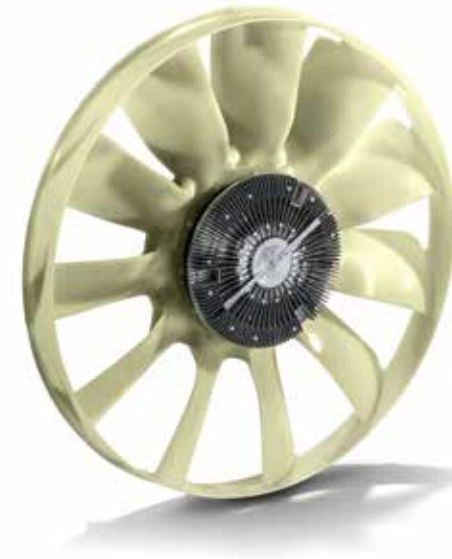
Ventilateurs moteur d'origine MAN à partir de: CHF 990.00