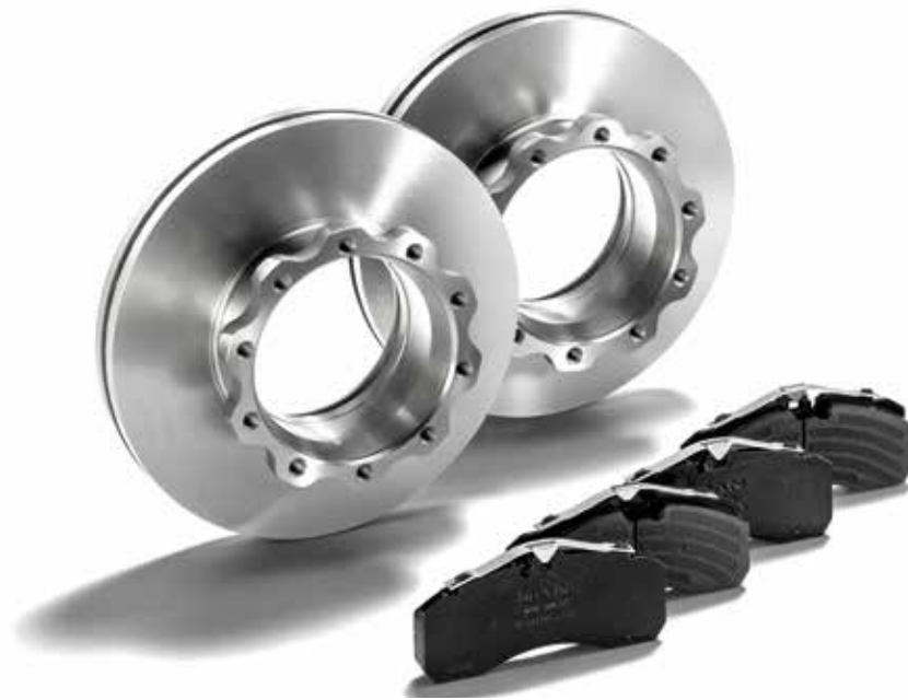
Disques de frein d'origine MAN à partir de: CHF 69.50