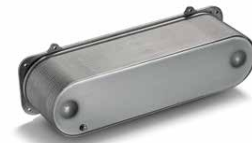
Refroidisseurs d'air de suralimentation d'origine MAN à partir de: CHF 565.00