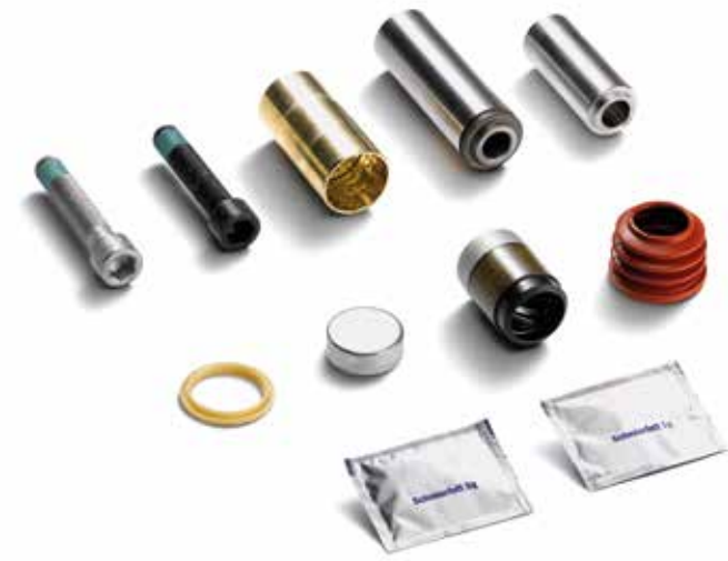
Matériels de réparation d'étriers de freins d'origine MAN à partir de: CHF 79.75