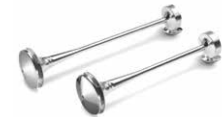
Avertisseurs et avertisseurs à air comprimé d'origine MAN à partir de: CHF 26.50