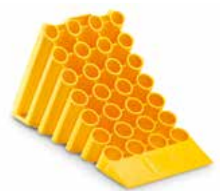
Calés d'origine MAN à partir de: CHF 31.00

Système vidéo de changement de direction d'origine MAN à partir de: CHF 1230.00 Système de caméra BirdView 360° d'origine MAN à partir de: CHF 2100.00 Enregistreur vidéo BirdView d'origine MAN à partir de: CHF 600.00