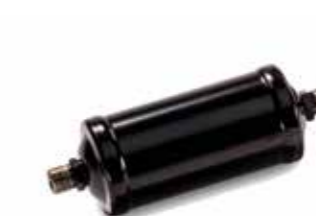
Cartouches de dessiccation d'origine MAN à partir de: CHF 94.50