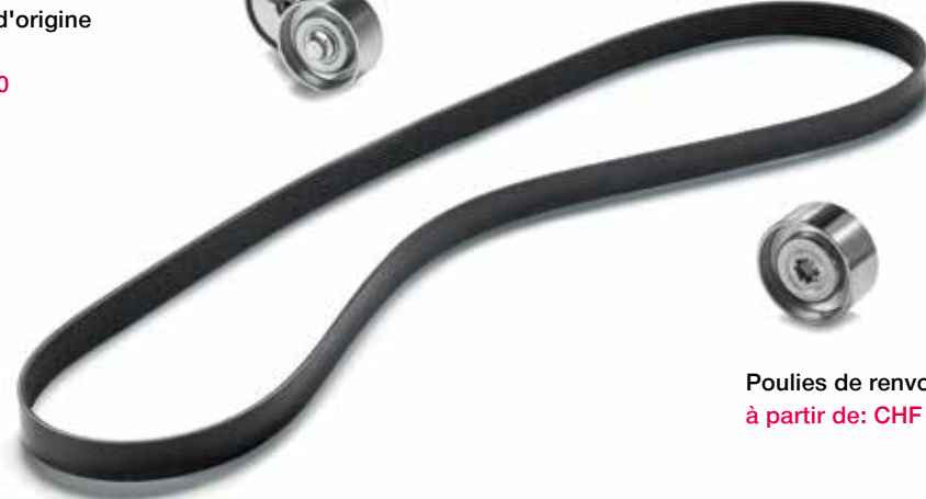
Poulies de renvoi d'origine MAN à partir de: CHF 37.00