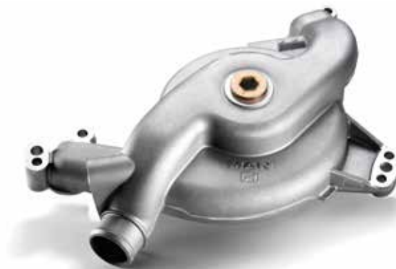
Pompes à eau de refroidissement d'origine MAN à partir de: CHF 230.00