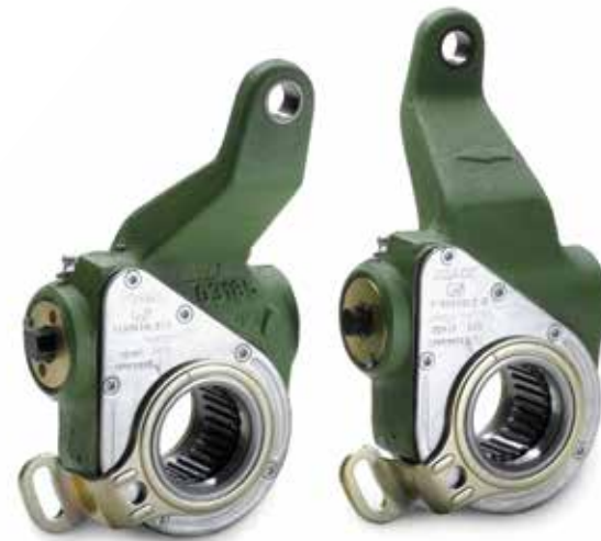
Régleurs de frein d'origine MAN à partir de: CHF 239.00