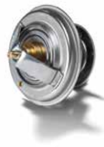
Thermostats d'origine MAN à partir de: CHF 17.95